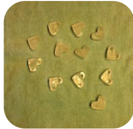
원형으로 배치하니, 시작과 끝이 명확하지 않다.