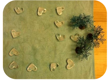
Tip: 아이들의 장난감 모형을 이용 게임 보드를 꾸며 본다.